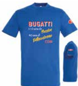
T-Shirt 110 ans S à 2XL