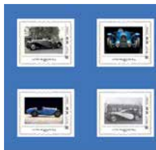
Timbre collector 110 ans