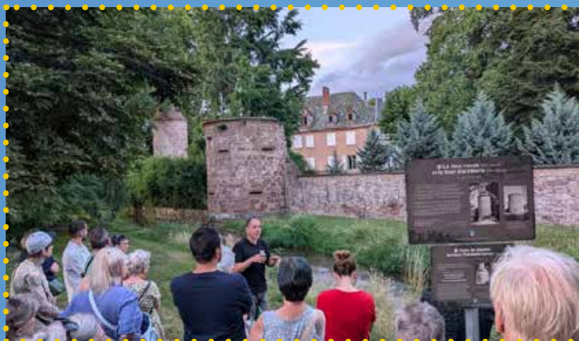
Visite de l'été de Dachstein

Visites guidées payantes durant l'été, des visites ludiques payantes en été et en automne