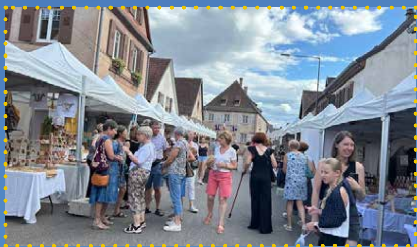
Marché Nocturne à Dachstein

Une à deux fois par an, nous réunissons des prestataires adhérents à un café presta' pour les informer sur des nouveautés ou des actions à venir