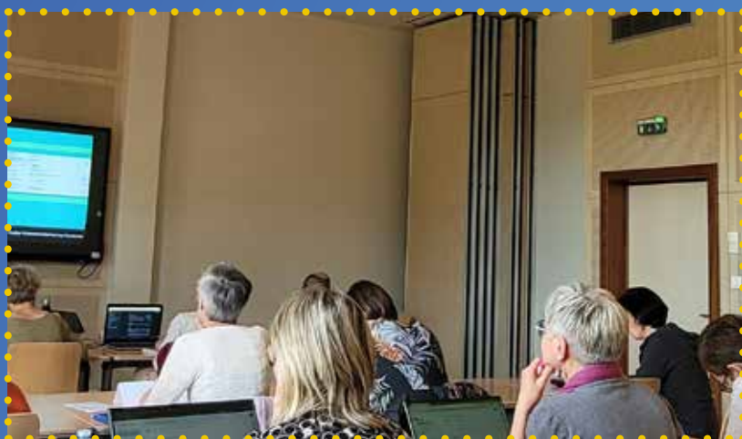
Formation chez Tremplin entreprise à Mutzig

Nous organisons des sessions de formation répondants aux besoins de nos adhérents.