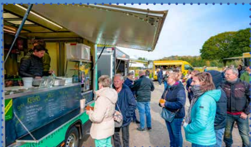
Fou de trucks festival à Gresswiller

La 4 ème édition du Fou de Truck Festival a eu lieu à Gresswiller. De nombreux Food de Trucks, exposants, photographes, viticulteurs sont venus partager leur savoir-faire et faire découvrir leurs spécialités.