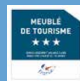
Classement Atout France

Vous retrouvez de plus amples informations sur notre site internet «services adhérents».