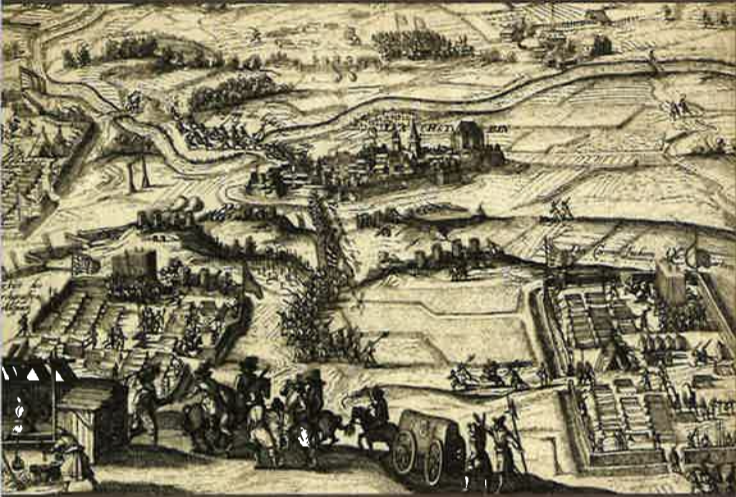
Représentation fantaisiste du siège de Dachstein par les princes de la Ligue protestante, lors de la guerre des Margraves. Gravure de Georg Keller, vers 1610.

S'étirant sur près de 2 km, Dachstein-Village et Dachstein-Care forment aujourd'hui une localité pittoresque, où il fait bon vivre et où la plupart des habitants ont su préserver leur patrimoine naturel et historique.